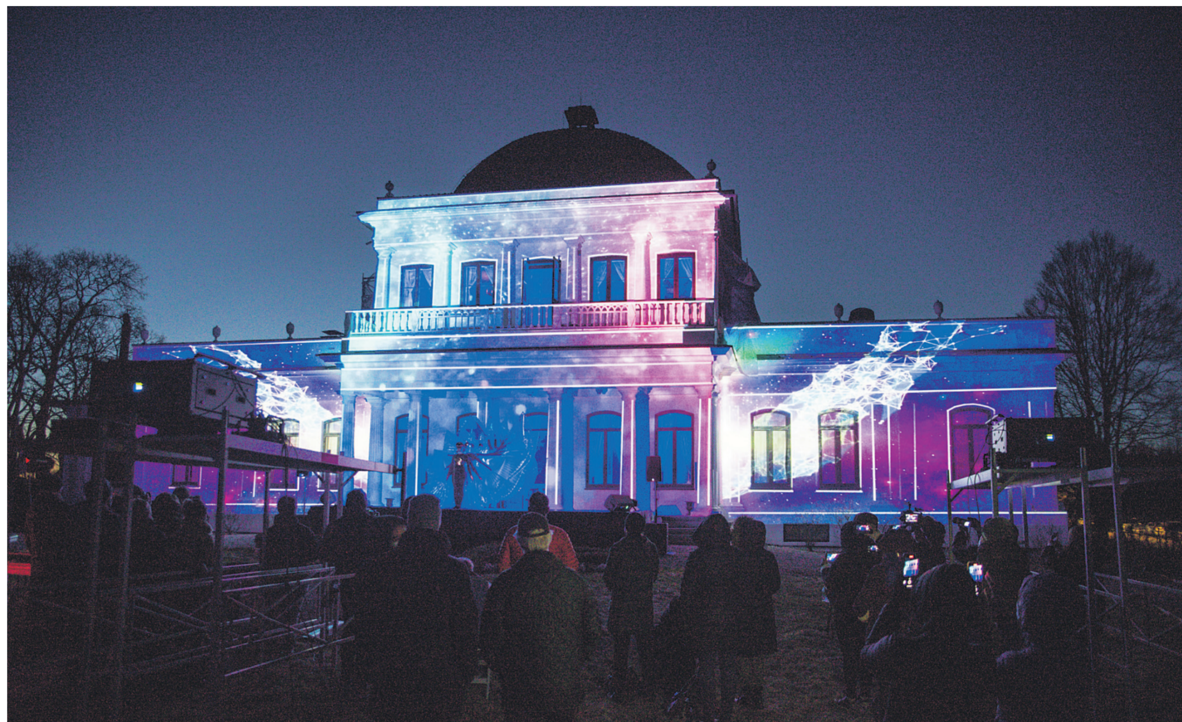
SLIK HAR DU ALDRI SETT HOVEDGAARDEN FØR: Noen få heldige fikk sett lys- og danseshowet Lys uten grenser på nært hold. Heldigvis ble det hele strømmet live. Noe som har gjort at over 8000 har fått med seg kulturskolens flotte show, i samarbeid med Telemark Museum og KRAFT.

Nå er skal showet også vises i Sverige hos samarbeidsskolen Sunne kulturskole. Håpet er at Nome-elevene får lov til å reise for å opptre der i september.