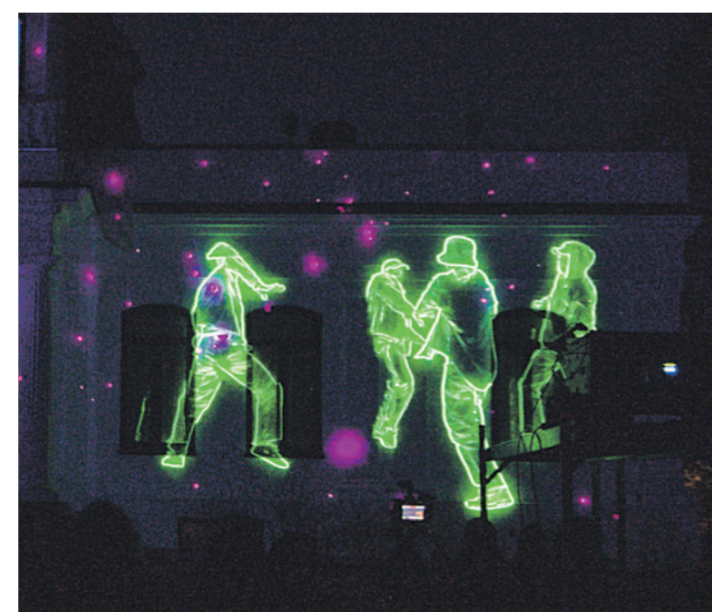
DANS OG LYS: Sunne kulturskole fra Sverige skulle egentlig besøkt Nome, men sendte i stedet et digitalt bidrag, som tok seg riktig så bra ut på de hvite veggene til Hovedgaarden.